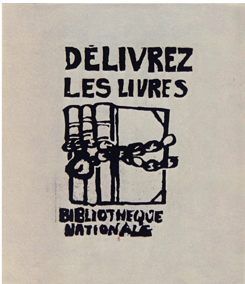
[Mai 68. Affiche], Bibliothèque nationale de France, ENT QB-1 (1968/15)-FT6

Campus Fonderie 16, rue de la Fonderie 68093 Mulhouse Cedex Tél. 03 89 56 82 65